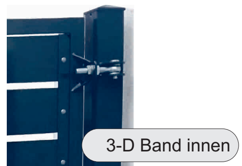
3-D Band innen